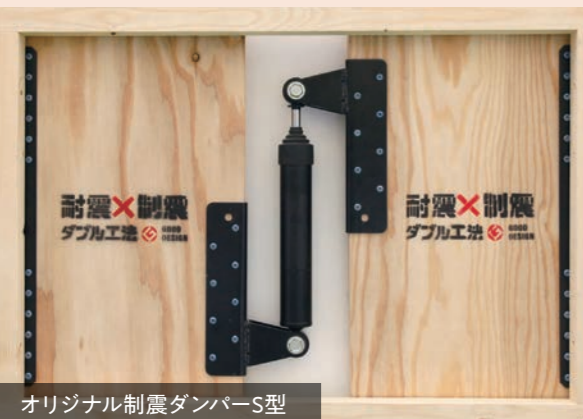
オリジナル制震ダンパーS型