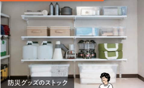
防災グッズのストック